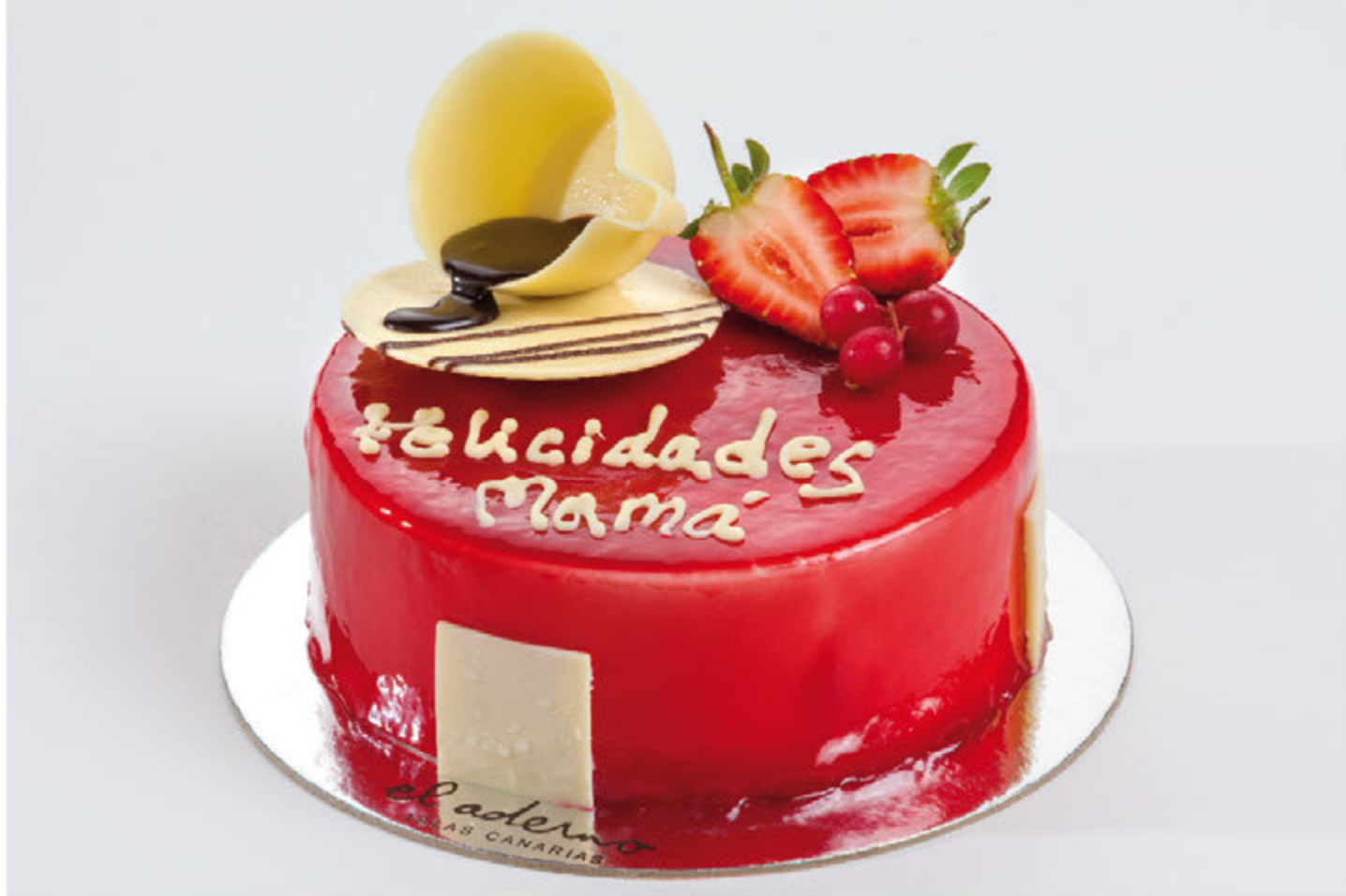
Zuleica para dos Día de la Madre mousse de vainilla con interior de frambuesa y bizcocho