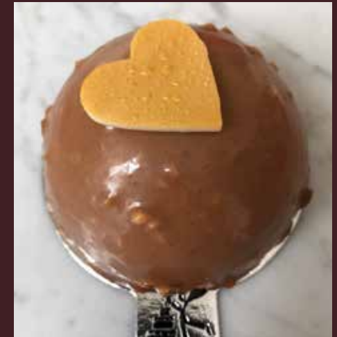
chocolate de leche Ferrer interior de gianduja 4944