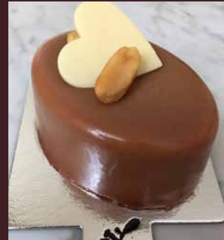
Izan chocolate, maní y caramelo 5660