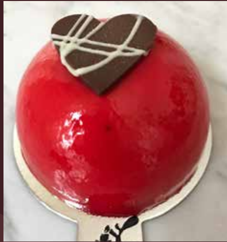
Zuleica vainilla y frambuesa 4943